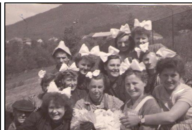
Pokračování z minulého čísla...