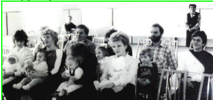
Náhodně vybrané fotografie jsou z vítání nových občánků v obci jsou z roku 1979 a 1986.