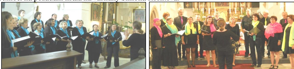
Ženský pěvecký sbor Luscinia z Ústí n. L. a smíšený pěvecký sbor Amytaky z Liberce