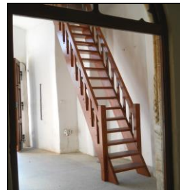
V 1. poschodí věže bývala místnost pro ponocného, do které se vcházelo po venkovním schodišti dveřmi, po kterých zůstal částečně zazděný dveřní otvor, který dnes slouží jako okno – snímek vlevo.