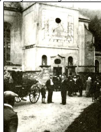
Na snímku je reprodukce části zápisu z roku 1718, 1924 a věž kostela kolem roku 1920.

Po roce 1945 kostel pomalu postupně chátral. Opadala téměř všechna venkovní omítka kostela, vitrážová okna byla rozbítá, střechou zatékalo... V roce 1999 byla opravena fasáda věže a kopule. Sluneční hodiny byly obnoveny v roce 2008 a v následujících letech byl opraven celý kostel. Po doplnění inventáře byl v roce 2012 opravený kostel vysvěcen. Na kopuli věže byl umístěn nový dvouramenný kříž. V roce 2016 byla také opravena celá vnitřní dřevěná konstrukce věže. Dnes si nikdo nedokáže představit, že by věž kostela stála na jiném místě, než na kterém stojí již 300 let.