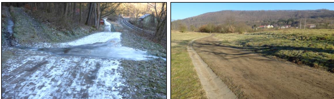
Cyklostezku Děčín – Benešov n. Pl. budoval Krajský úřad Ústí n. L. Zatím nebyla předána do vlastnictví obcí, takže za současný stav cyklostezky zodpovídá stále Krajský úřad Ústí nad Labem. Na snímku cyklostezka do Benešova n. Pl. – únor 2018.