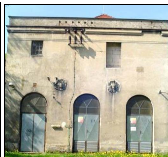
Vlevo část plánu elektrárny (příčný řez) z dokumentace v roce 1980 a fotografie elektrárny v současnosti.

Elektřina byla v Malé Veleni zavedena v roce 1912 a současně byla instalována elektrická pouliční světla. Když ale v roce 1945 přišli čeští osídlenci, nebyla tato pouliční síť použitelná. Nové pouliční osvětlení bylo slavnostně zapnuto na 28. 10. 1954.