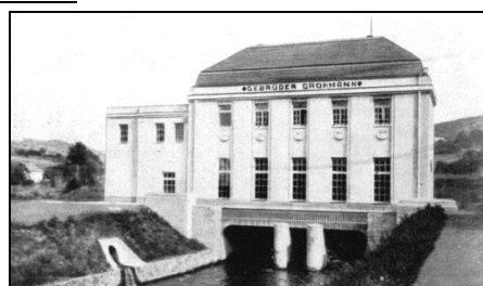
Kresba elektrárny z kroniky O. Banseta ke kapitole „Průmysl“. Vpravo fotografie elektrárny z roku 1930.

Koryto dnešní Ploučnice je přehrazeno na svém toku několika jezy. Půjdeme-li po proudu od Benešova n. Pl., první jez nalezneme v prostoru bývalého Benaru 05, dnešní NIKOH. U Eliščina údolí se odděluje u jezu od řeky náhon, který přivádí vodu k továrně v Jedlce. Zde poháněla voda Kaplanovu turbínu.