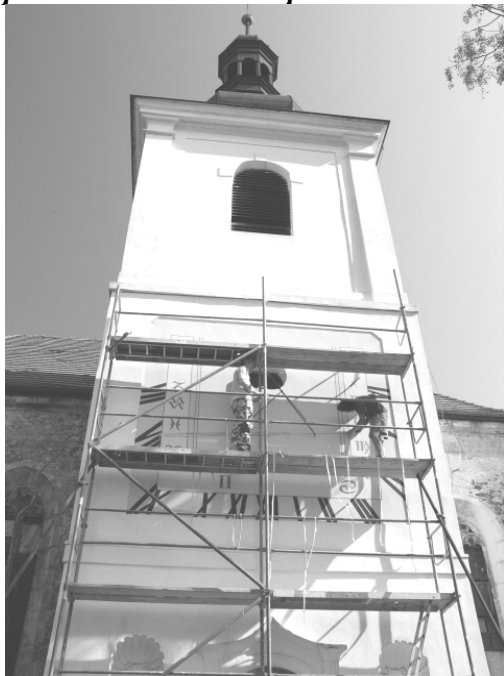
Nahoře fotografie z dokončovacích prací. Dole historická fotografie asi z roku 1920.

Svému synovi, Milanu Dostálovi, moc děkuji za to, že se ujal nelehkého úkolu, vyhledal a nastudoval na internetu teorii slunečních hodin, našel patřičné programy a podle nich přesně stanovil polohu čar, znaků a číslic. A to nejen na papíře, ale základní grafiku, rozmístění čar a symbolů provedl se mnou i na ploše slunečních hodin.