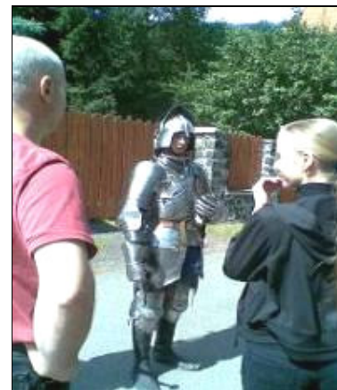
Prodejní stánky . Vpravo výstroj rytířů, kteří takto nosí na sobě 35 kg brnění.