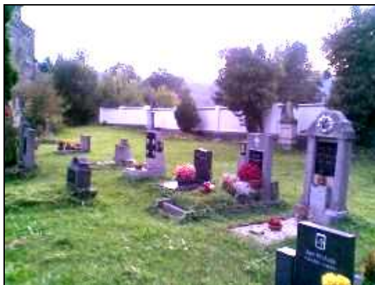
Na snímku vlevo stav hřbitovní zdi v roce 1980. Vzadu je vidět původní cihlová zeď s pomníky kolem zdi. Vpravo je opravená zeď z roku 2009

Zedníci, kteří opravovali zeď již odešli, uklidili. Zanechali pouze vyšlapanou cestičku úhlopříčkou přes louku. Smutné je, že po ní stále chodí a dále ji prošlapávají i návštěvníci hřbitova. Ti si udělali cestičku ještě jednu přes vyznačený obdélník s nízkými keři. Je to opravdu nutné?